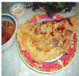
Bánh Xèo Sprøde rismelpandekager