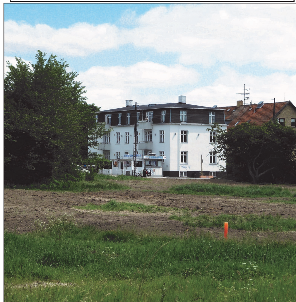
Ejendom på Vigerslevvej set fra Vigerslevparken