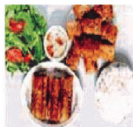
Bún Chả giò Risnudler med forårsruller