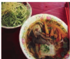
Bún Bò Huế Oksekødsuppe med stærk citrongræs

Kom og prøv vores vietnamesiske retter, f.eks.: