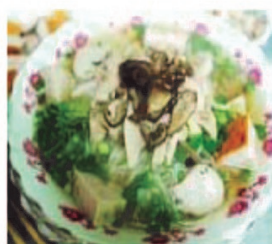
Bún Mộc Risnudelsuppe