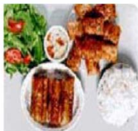
Bún Chả giò