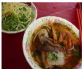
Bún Bò Hué Oksekødsuppe med stærk citrongræs

Kom og prøv vores vietnamesiske retter, f.eks.: