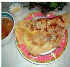
Bánh Xèo Sprøde rismelpandekager