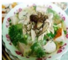
Bún Mọc Risnudelsuppe